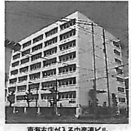
東海支店が入る中産連ビル

「英国で重要性痛感」というのは、海外での競争環境が厳しくなっていることを指している。日本の新聞も信頼度は世界有数であるという自覚を持って、さらなる発展を期している。