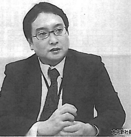
元銀行マンの社長

「仕事の流れは変わる」というのは、業界全体の環境変化を指している。発想の転換が一番の悩みであるというのは、新しいビジネスモデルへの適応が難しいと感じていることを示している。