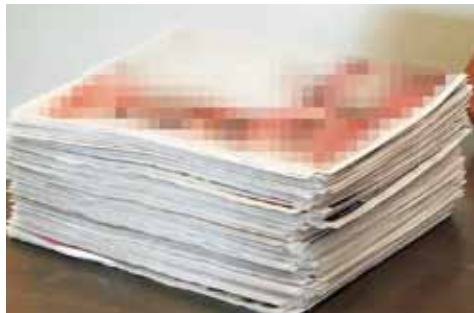
従来機で丁合したチラシ