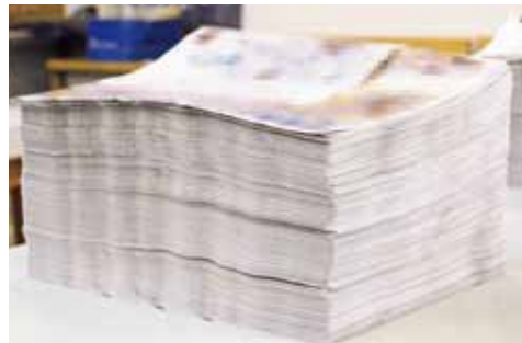
TZR-SCで丁合したチラシ